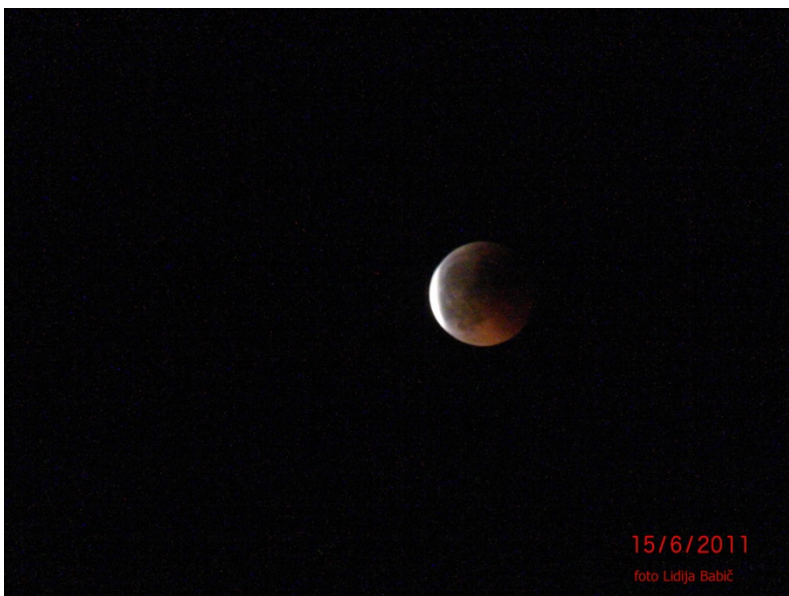
prehod v Zemljino plosenco, 23:07