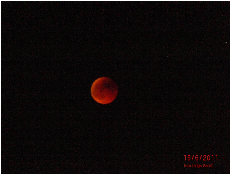
v Zemljini senci ob 22:39

Vse slike so bile posnete s fotoaparatom Casio Exilim.