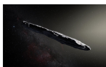
Slika 1: Predvidena oblika medzvezdnega asteroida `Oumuamua [1].

Oktobra letos smo lahko prvič opazovali asteroid, ki ne izvira iz Sončevega sistema, ampak je vanj pripotoval iz medzvezdnega prostora. Opazovanja Zelo velikega teleskopa (Very Large Telescope, VLT) v Čilu in še nekaterih observatorijev na Zemlji so pokazala, da je ta zanimiv objekt potoval skozi vesolje milijone let, preden se je naposled znašel v našem planetarnem sistemu. Asteroid je temen, rdeče barve in dolg, na videz je po obliki podoben cigari. Sestavljen je večinoma iz kamnin z veliko vsebnostjo težkih kovin. Rezultati odkritja so bili objavljeni v reviji Nature 20. novembra 2017.